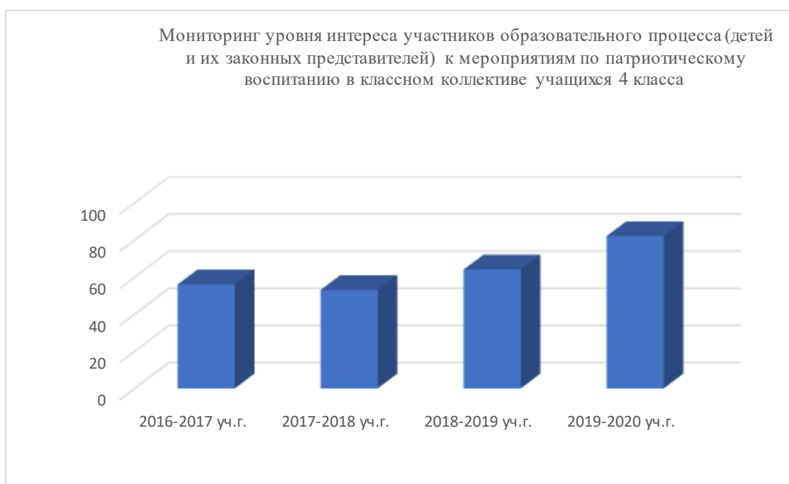
Диаграмма 1. Мониторинг уровня интереса участников образовательного процесса к мероприятиям, реализуемым посредством Программы

Согласно данным опроса общественного мнения, обучающиеся и их законные представители 1, 2 выпуска положительно оценили внедрение Программы воспитания и социализации обучающихся